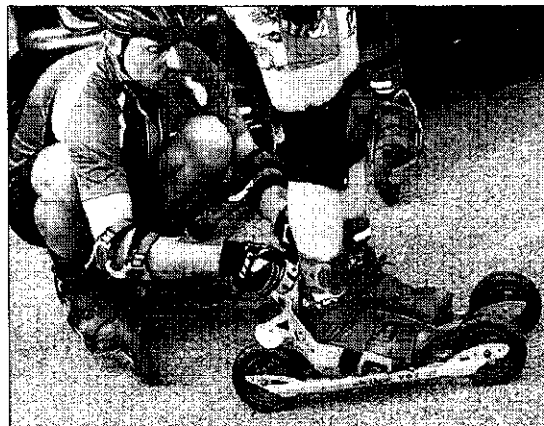
Die Skikes werden angepasst. Wichtig ist die fachmännische Einstellung der Bremse am Hinterrad.

Ralf Wurster ist Skike-Händler und gibt Schnupperstunden, Einsteiger- und Aufbaukurse. Infos unter www.skikepoint-goepingen.de